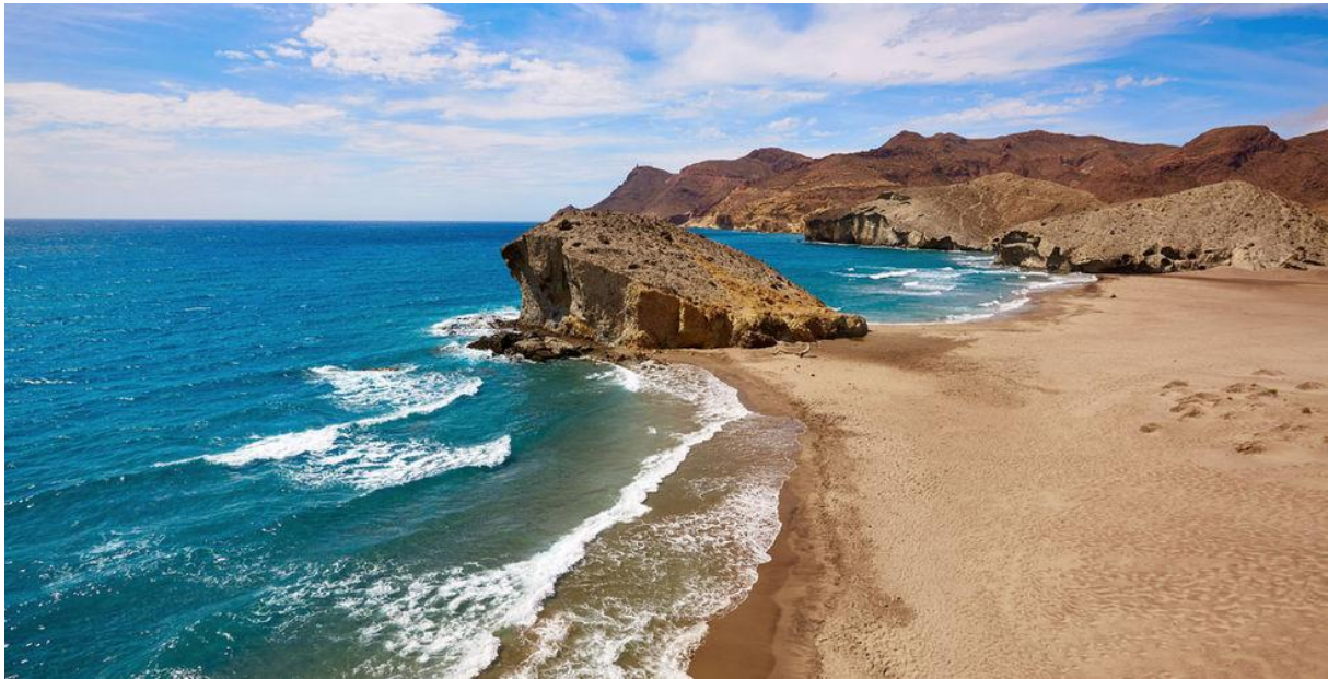
Imagen 1. Playa de los Muertos / Parque Natural de Cabo de Gata-Níjar.