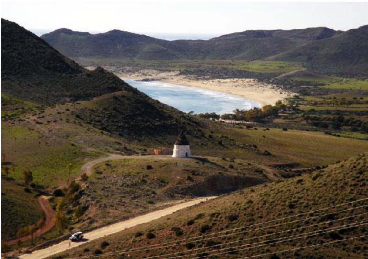
Imagen 2. Parque Natural Cabo de Gata-Níjar.