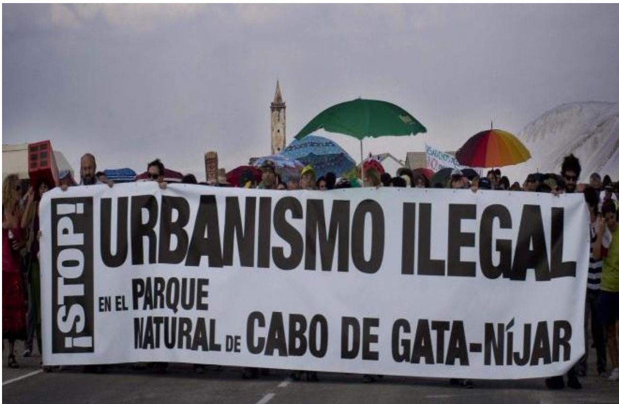
Imagen 4. La ciudadanía en defensa del Paisaje.