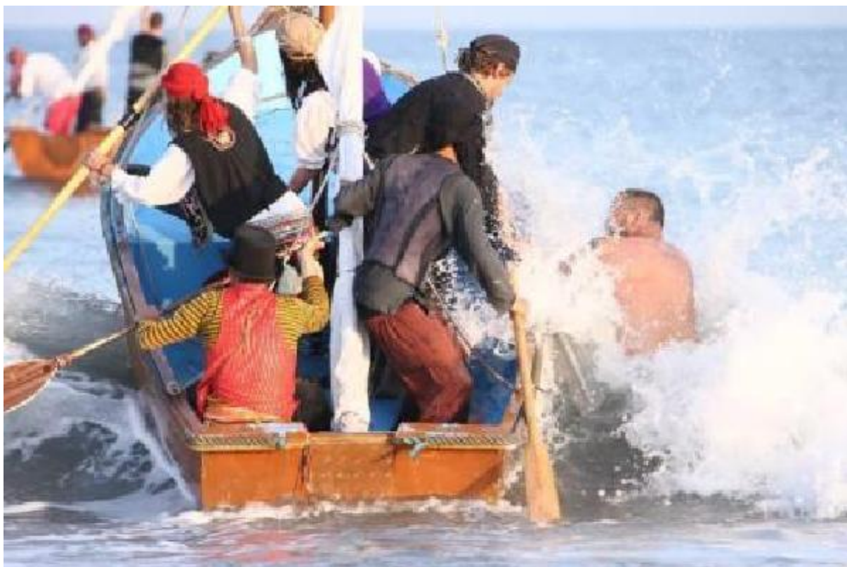
Imagen 3. Gráfico de los niveles metodológicos de análisis.