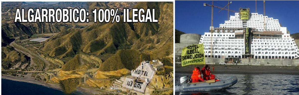
Imagen 5. sobre “El Algarrobico”.

en un importante y simbólico hito de esa lucha por la defensa y protección medioambiental y de la ordenación integral del litoral.