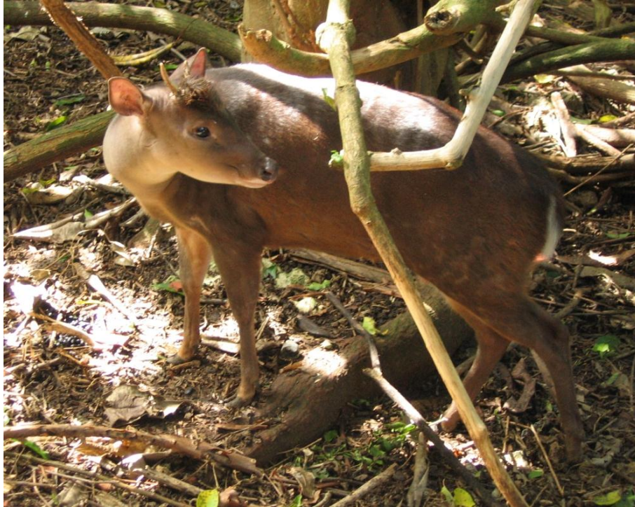
Figura 01. Veado-mateiro ( Mazama americana Erxleben, 1777)

caça e os incêndios florestais são as principais causas para a redução das populações desta espécie (Machado et al. 2008, Duarte et al. 2012).