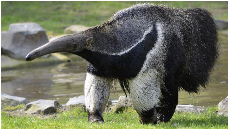
Figura 02. Tamanduá-bandeira ( Myrmecophaga tridactyla Linnaeus 1758)