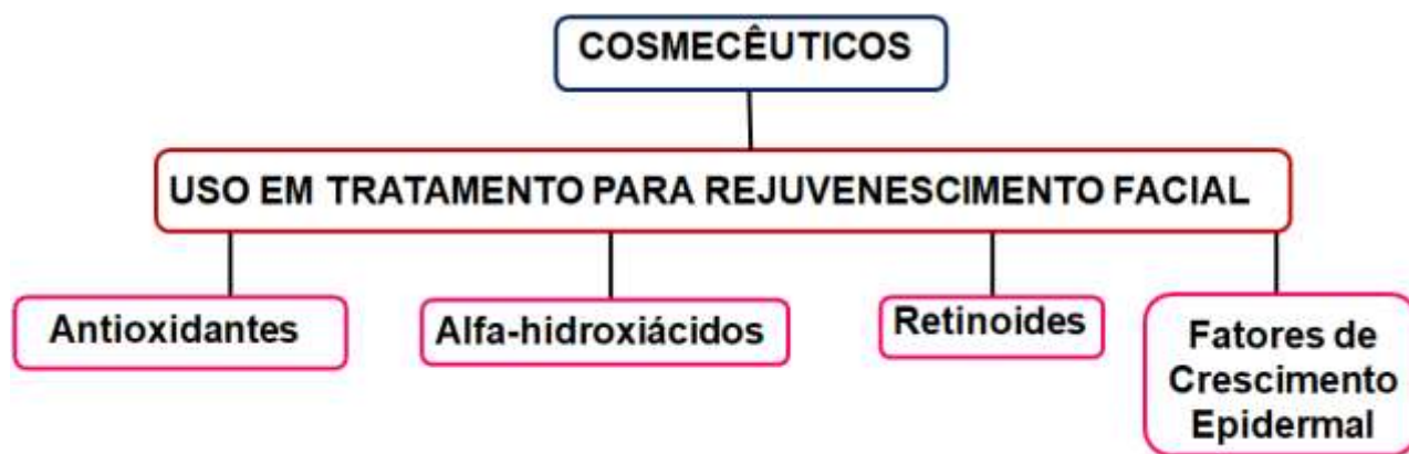
Figura 02: Principais tipos de cosmecêuticos empregados em tratamentos estéticos para rejuvenescimento facial.