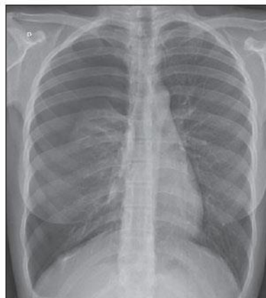
Figura 3: Radiografia de Tórax evidenciando pneumotórax à direita.

Outrossim, exames complementares podem ser solicitados para o embasamento das hipóteses diagnósticas, como a radiografia torácica (Figura 3) (AZIZAD-PINTO; CLARKE, 2014) e a tomografia computadorizada (TC) para a visualização das lesões características da síndrome da endometriose torácica (BADAWY; SHRESTHA, 2014; AZIZAD-PINTO; CLARKE, 2014). Além disso, o uso da Ultrassonografia Transvaginal (USG) é indicado a fim de verificar a presença de endometriose pélvica, caso a paciente não possua esse diagnóstico até o momento (FREITAS et al., 2011). Marchiori et al. (2012) também defende o uso da Ressonância Magnética no diagnóstico da Síndrome da Endometriose torácica.