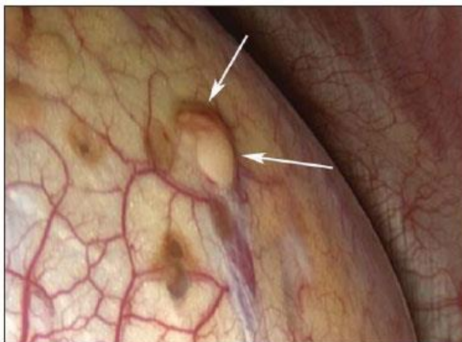
Figura 4: Achado intra-operatório de focos endometrióticos na superfície pleural.

O PC tem surgimento idiopático e poucos casos foram relatados na literatura. Assim, ainda há muito o que se debater. Os melhores resultados terapêuticos foram obtidos associando-se a exérese do tecido endometrial por videotoracoscopia (Figura 4) com o uso do tratamento hormonal pós-cirúrgico, que apresenta como vantagem a possibilidade de envio de material para confirmação do diagnóstico anatomopatológico (SHRESTHA et al., 2019).