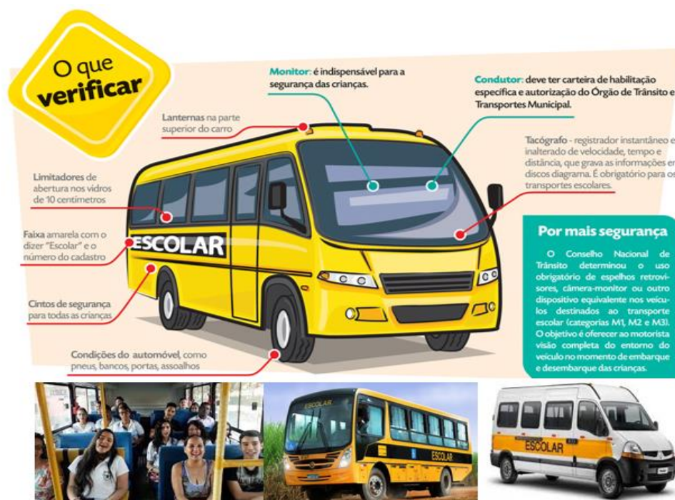
Figura 3: – O Acesso à escola e a regularização do Transporte escolar